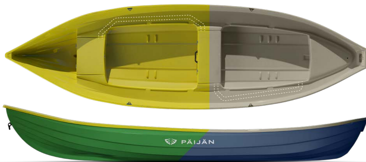
Mallikuvassa Päijän 471L