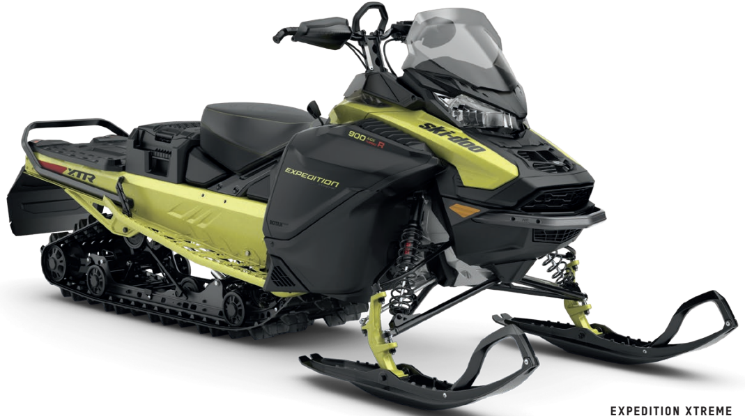
EXPEDITION XTREME 900 ACE TURBO R KUVASSA