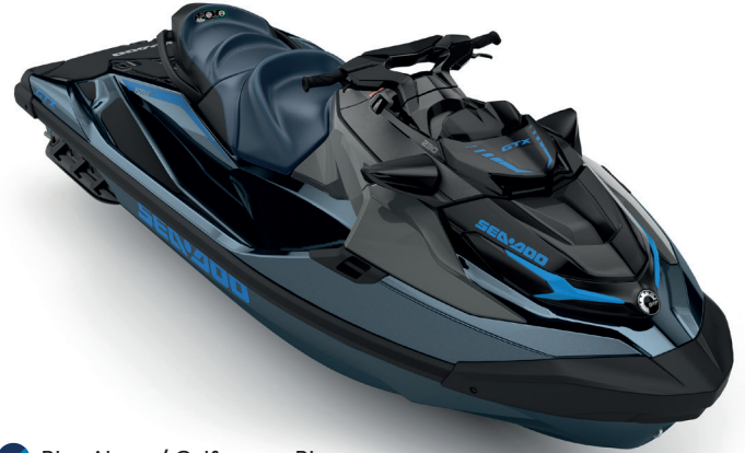
Blue Abyss / Gulfstream Blue